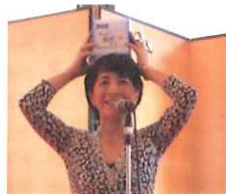
実行委員長: 阿川 佐和子

東日本大震災被災地の 「特産物・加工メーカー・お店」と、 銀座の持つ「ブランド・名店・職人・ノウハウ」 とをつなげることで、新しい商品・サービス・ メニューを生み出すキッカケを作り出すことを 支援していくプロジェクトです。