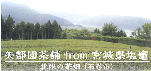
矢部園茶舗 from 宮城県塩竈 北限の茶畑(石巻市)